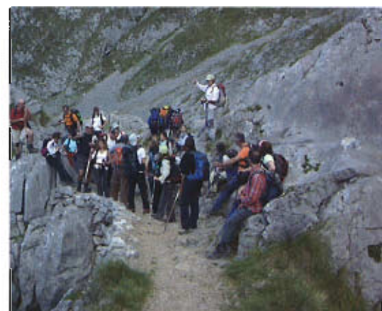
Un descanso en un puente de roca que separa dos simas formadas por dolinas de colapso.