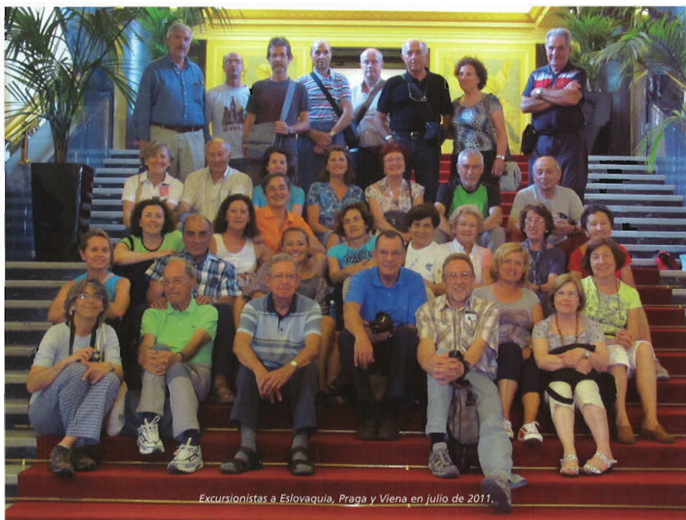
Excursionistas a Eslovaquia, Praga y Viena en julio de 2011.