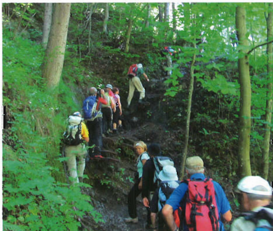
Slovenky Raj (Paraíso Eslovaco)

El primer día hicimos una corta travesía desde Skalnaté Pleso, la estación intermedia del telecabin que sube al Lomnický, a Tatranská Lomnica, bajando por el valle del Zelene Pleso, el Lago Verde, y subiendo, en medio de una nevada totalmente inesperada en pleno julio, a una pequeña cumbe de poco más de dos mil metros, Velká Svistovka (y como el teclado de nuestros ordenadores no tiene algunas de las consonantes de las lenguas eslavas, los nombres que estoy poniendo sólo se parecen algo, no mucho, a los de verdad). El segundo día hicimos una larga travesía por los dos Valles del Frio, Studená dolina, subiendo por el pequeño, bajando por el grande y pasando de uno al otro por Priečne sedlo, un collado a 2352 m. de altura que tiene una subi-