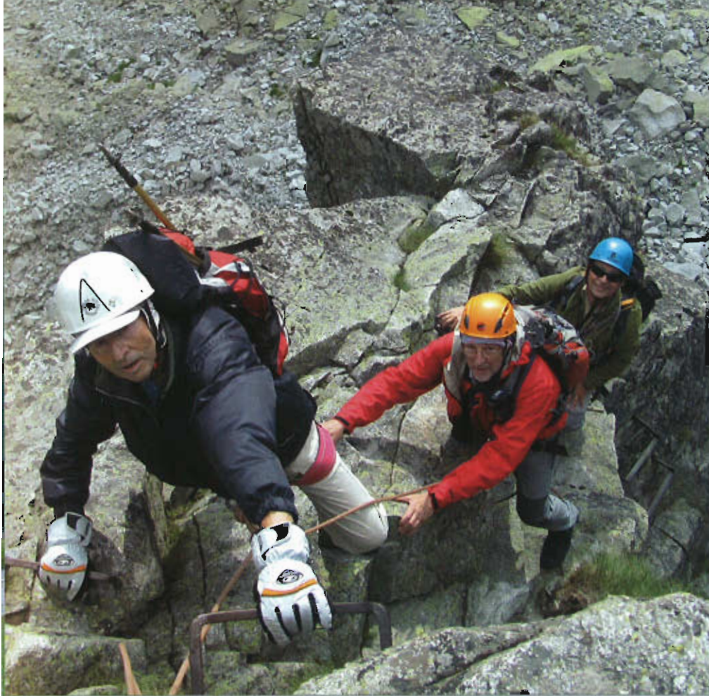
Ascendiendo al Gerlach.

Nosotros subimos por la vertiente SE y descendimos por la SO, y ambas exigieron una trepada o un destrepe continuo de unos quinientos metros de desnivel sin nada que indicase como desenvolverse en cada momento en un auténtico lío de llambrias, pedreros y canalizos, salvo el guía que llevábamos, que era ya la tercera vez en esa semana que subía al Gerlach y se conocía el terreno como el pasillo de su casa aunque la mayor parte del tiempo fuimos en medio de una densa niebla que a duras penas permitía unas decenas de metros de visibilidad. Si uno en vez de al Gerlach va a otro de los "2600" la primera de las razones perderá parte de su validez, pero el aspecto que tienen hace temer que la segunda la conserve íntegra. Salvo que sea al Lomnický, con 2634 m. la segunda cota de los Tatras, a cuya cima sube un telecabin desde la misma Tatranská Lomnica. Aunque nuestra experiencia, tanto del 2006 como de este verano, nos dice que es más difícil conseguir sacar un billete para subir en él cuando el tiempo es bueno que ascender al Gerlach.