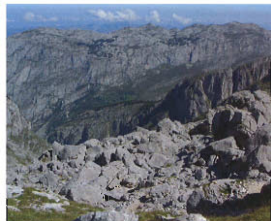
Antigua avalancha de rocas en el camino a Urriello.

los procesos geológicos que el que forman los montañeros. Y es que, evidentemente, los montañeros nos damos cuenta de que es la geología la única que explica cómo han surgido y cómo han evolucionado esas montañas que tanto amamos.