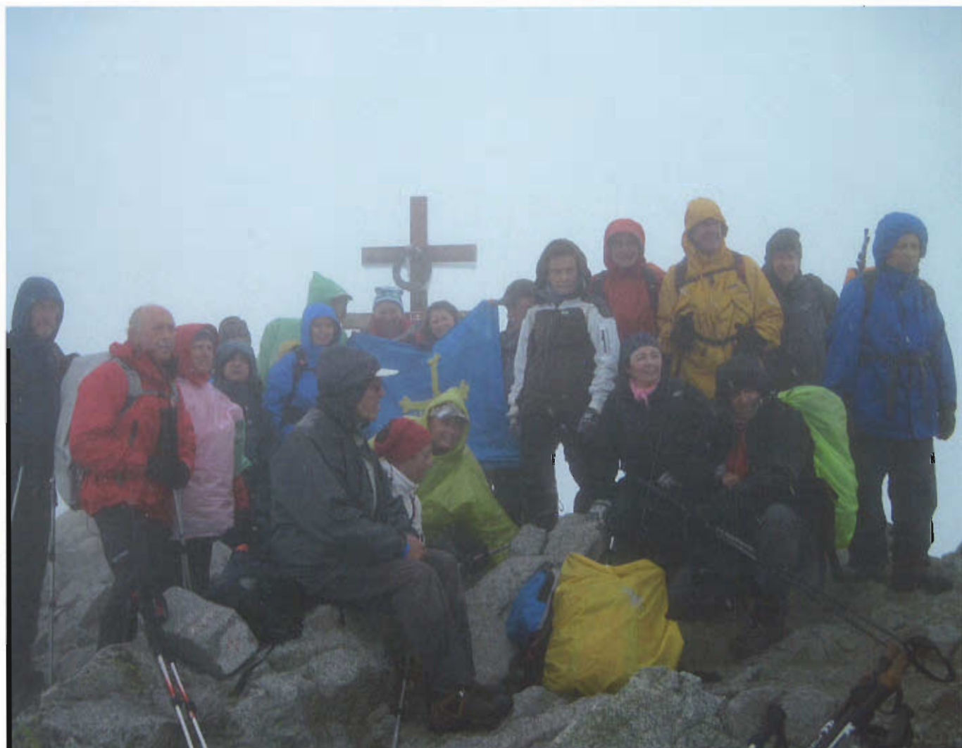
Cumbre del Kriváň (2.495m)

tanto nuestras actividades, porque no dejamos de ir a ningún sitio a causa de ese mal tiempo, sino lo que pudimos disfrutar de ellas.