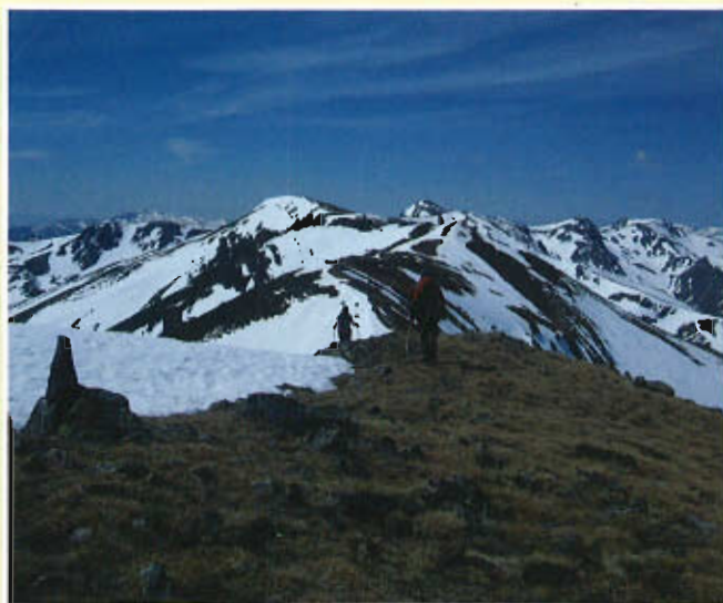
Vistas de la crestería de la Sierra Bandín.

de toda duda. Destaca un antiguo palacio, que años atrás sufrió un incendio que solo le dejó en pie las paredes. Por suerte fue restaurado "gracias a la prestación personal y al