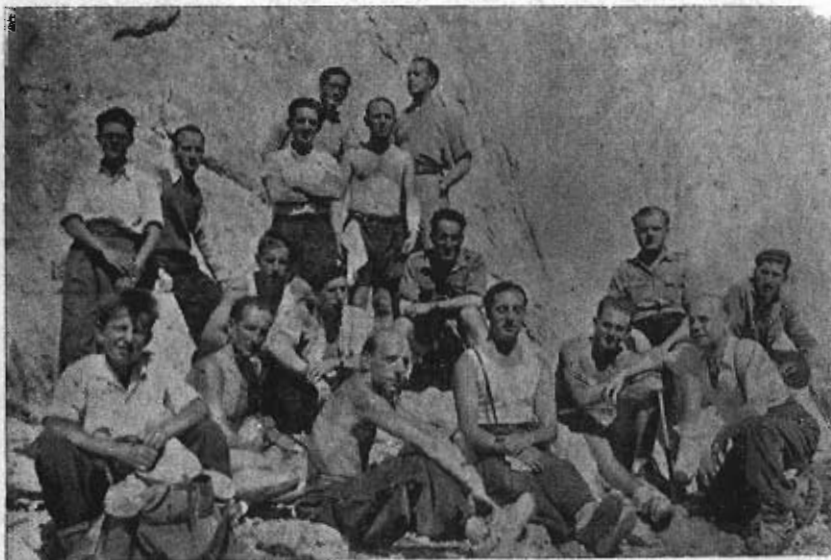
Los Montañeros del Grupo al pie del Naranjo