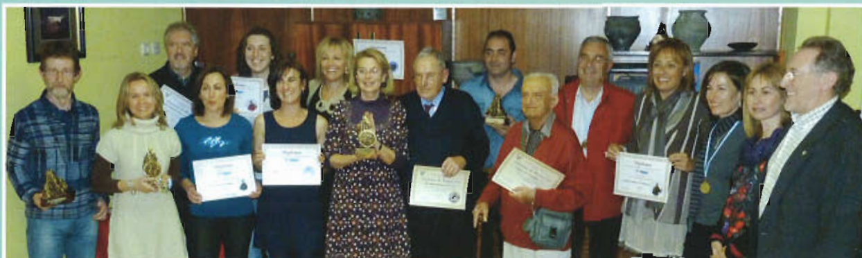
Ganadores de trofeo y socios Homenajeados.

Para finalizar el acto, homenajeados, premiados y demás asistentes tuvieron la oportunidad de compartir ya informalmente el acto participando de un "pincheo" donde se aprovechó para confraternizar y relatar las múltiples anécdotas de nuestras "colectivas".