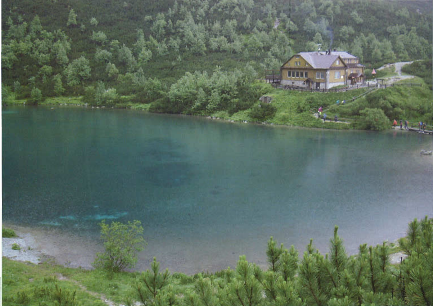
Zelená ples (Lago Verde) y Refugio

ta tenían muy poca infraestructura turística y eran muy baratos, pero que en los cinco años que han transcurrido desde entonces han aumentado espectacularmente tanto las posibilidades de alojamiento como, con Eslovaquia en el euro desde 2010, los precios. Aunque incluso así siguen siendo asequibles, y un chollo si uno los compara con los de los Dolomitas o los Alpes suizos.