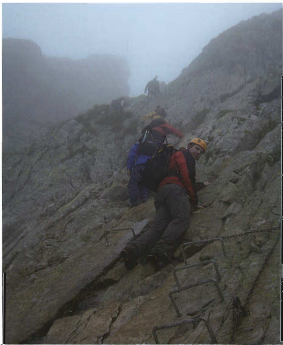
Ascensión al Prielne sedlo >

Nuestro viaje de este verano, centrándonos ya en él, consistió en diez días en Tatranská Lomnica durante los cuales hicimos por los Altos Tatras cuantas excursiones nuestras fuerzas permitieron y algo de turismo por el este de Eslovaquia, y luego unos días más de estancia en Praga y en Viena, aprovechando que volábamos a la segunda de estas ciudades, para diversificar intereses y de los que tampoco contaremos nada más. En los Tatras tuvimos, a diferencia de cuando estuvimos en Zakopane, el mal tiempo habitual, quizá por lo que nos contaron incluso un tiempo un poco peor del habitual, lo que limitó no