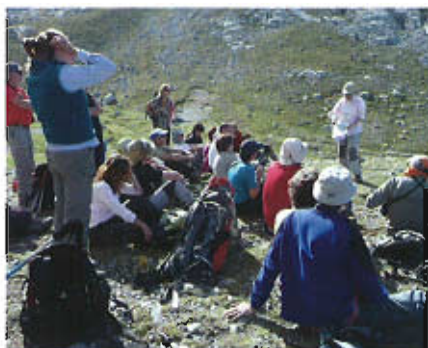
La Vega de Urriello, un aula singular.