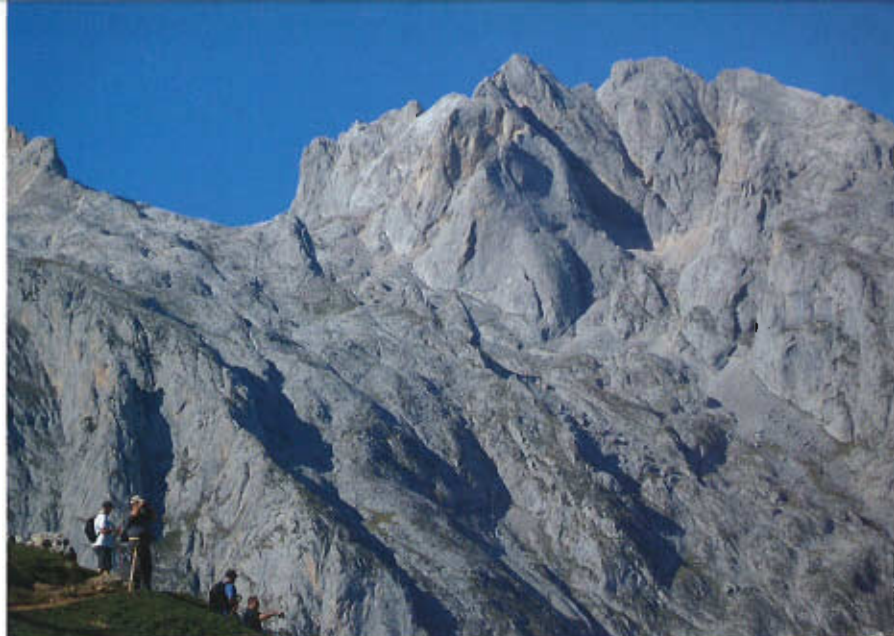
El fondo de muchas laderas de los Picos, como ésta, situada bajo Los Albos, ha sido modelado por el paso de una lengua glaciar.