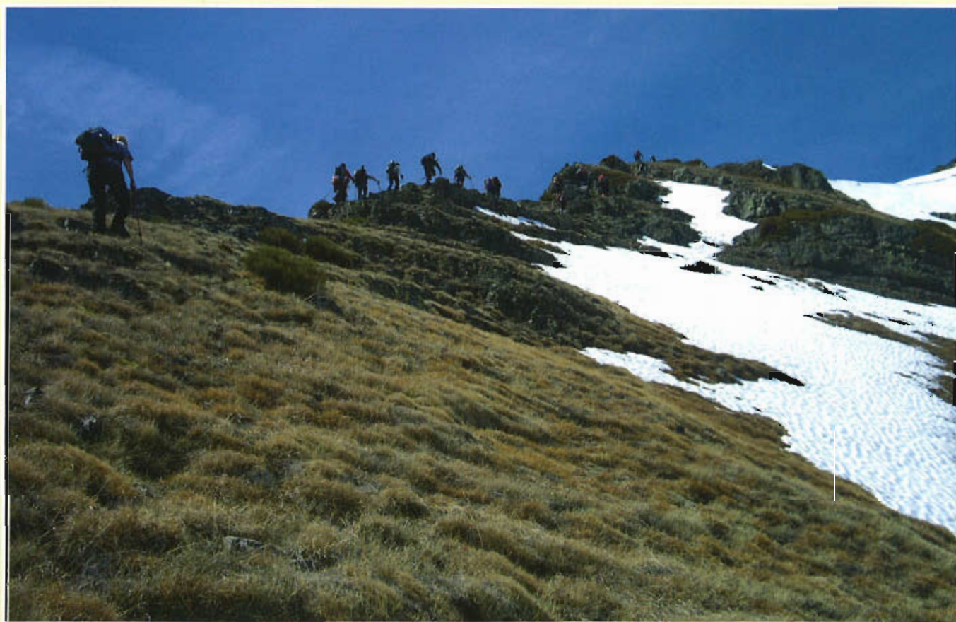
Ascendiendo por la zona de Los Churros

N os disculpamos de entrada por esta pequeña exageración humorística del título. Pero es que si no se toma con humor esta excursión, es fácil que a mitad del recorrido nos apetezca recurrir al famoso diccionario de Don José Camilo Cela. Qué