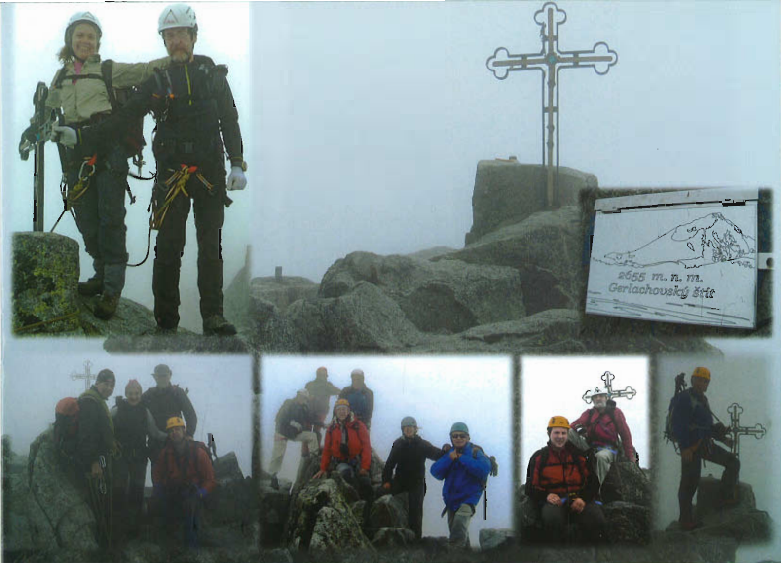
En la cumbre del Gerlach (2.656m)

da de mucho cuidado equipada con una ferrata; también de 2000 m. hacia arriba estuvimos metidos en la niebla, y nos cayeron un par de buenos chaparrones. El tercer día subimos al Krivan, 2495 m., la máxima cota del macizo más suroccidental de los Altos Tatras y la montaña por excelencia de los eslovacos, que la han elegido para el reverso de sus monedas de uno, dos y cinco céntimos; dos grados y aguanieve en la cumbre. El cuarto día, ¡eureka!, hizo bueno, y tuvimos un magnífico día para hacer otra larga travesía por los valles de Furkotska y Mlynicka, pasando también del uno al otro por otro alto collado equipado, Bystre sedlo, 2314 m., aunque con una trepada mucho más corta y fácil que la de unos días antes; pudimos contemplar por una vez despejadas todas las mayores alturas de los Tatras, incluyendo al Gerlach al que íbamos a ir el día siguiente. Y por último hubo una quinta excursión, pero ya fuera de los Tatras, en otro parque nacional a unos veinte o treinta kilómetros que llaman Slovensky raj (el Paraíso