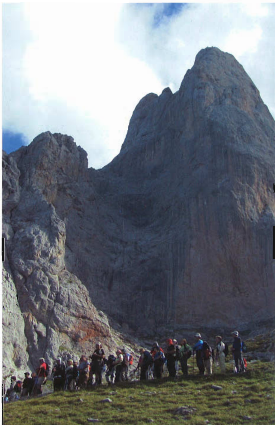
Una parada del grupo bajo el Pico Urriellu. La verticalidad de estas paredes es resultado de la excavación y el pulido realizados por la gran masa de hielo que en el pasado cubrió esta zona.

N aturalmente, el programa de la excursión no debería contener tan sólo objetivos naturalistas, sino buenos atractivos montañosos, algo que se logró plenamente llegando a la Vega de Urriello a través de una ruta muy poco frecuentada y de gran espectacularidad: la que, abandonando el camino normal después de cruzar la canal del Valleyu, asciende por los Jous del Carnizoso y alcanza la Morra del mismo nombre, magnífico mirador a la sobrecogedora pared norte del Pico y a las profundidades de la Canal de la Celada.