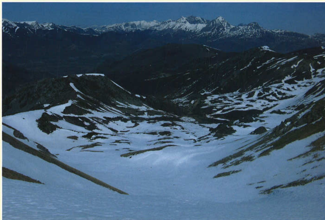
Cabecera del Valle de Riolago con la Foz de San Bartolo y al fondo, Las Ubiñas.

Nosotros hemos tenido la suerte de conocer a otro babiano de pro, Don