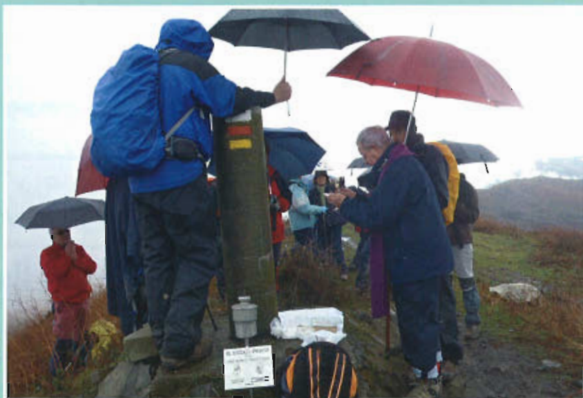
Un momento de la misa oficiada por Rodrigo Sastre.

El día se remató en el Restaurante Casa Lobato de Ribera de Arriba donde dimos cuenta de una excelente comida, a base de pote, cabritu, buen vino y unos postres caseros que nos dejaron a todos con un excelente sabor de boca.