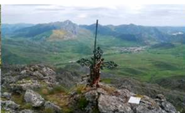
Cumbre de Peña Laza