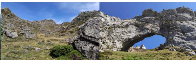
Caos de roca de la plataforma superior