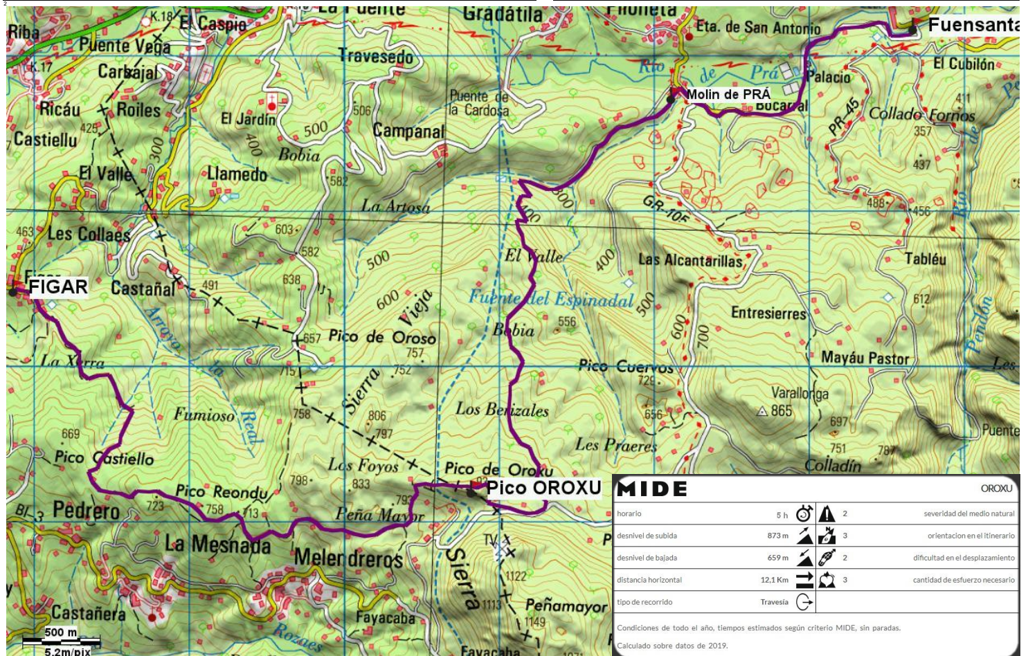
Itinerario marcado sobre un recorte del mapa 1:25.000 del I.G.N