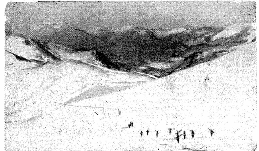
De las pistas de Pajares.-Camino de Cueto Negro para efectuar la prueba de descenso

Organizar una exposición de cuadros de montaña en beneficio de la Federación, en el Salón provisional de Exposiciones de la Caja de Ahorros de Asturias.