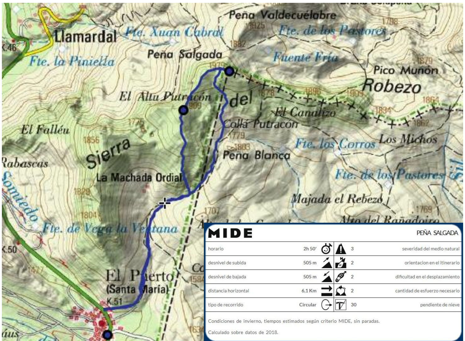
Recorte de mapa IGN 1:50.000